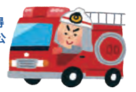
＊お問合せ：消防保安課

● 地域防災の要である消防団員の減少が続いていることから、事業税軽減措置のほか、地震・津波対策等減災交付金による消防団詰所や資機材等の整備への助成等を行い、消防団員の活動環境の整備を図るなど、消防団の充実強化に取り組んでいます。 ・消防団の資機材等整備等に対する財政支援 消防車両、消防団の詰所や消防団資機材の整備等に対する財政支援：619千円（交付決定額） ・準中型自動車免許取得助成 消防団員の準中型自動車免許取得に関して市町に対し補助金交付（公益財団法人静岡県消防協会）（補助率1/3以内上限8万円） ＊お問合せ：消防保安課