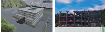
＊完成予想 金丸建築設計事務所より ＊令和7年1月現在の工事状況

● 県立沼津商業高等学校の新校舎工事は、基礎工事が終わり5階部分まで鉄骨の工事が行われています。現在の進捗率は59%（令和6年10月時点）で、令和8年度2月の竣工を目指し建設工事が行われています。 ＊新校舎は、吹抜けを設けた開放的な平面計画とシンプルな外観が特徴です。 ＊お問合せ：建築管理局建築工事課・設備課