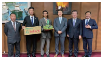
●2024.11.28 静岡県レタス協議会 静岡レタス「うまレタ。」の皆様と意見交換する