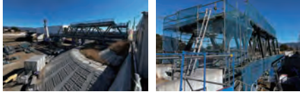
＊令和7年1月現在の工事状況

● 下土狩徳倉沼津港線徳倉橋側道橋工事は、A1橋台、P1橋脚工事が完了し、引き続き、A2橋台の工事に着手する予定です。令和9年3月の完成、供用開始を目指しています。 ・令和6年10月～令和7年5月：左岸側上部工の実施 ・令和7年10月～令和8年5月：右岸側上部工の実施 ・令和8年10月～予定：床版、舗装工事 ＊お問合せ：県沼津土木事務所