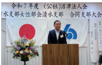
●2025.5.26 『令和7年度沼津法人会清水支部・女性部会清水支部 合同支部大会』に参加し皆様と意見交換する