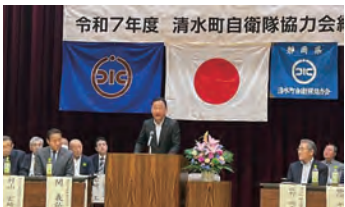
●2025.6.7 『令和7年度清水町自衛隊協力会総会』に参加し皆様と意見交換する