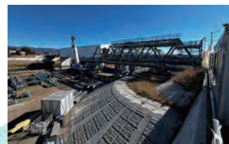
*令和7年1月現在の工事状況