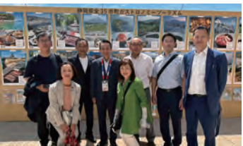
●2025.6.6 大阪万博『静岡県ブースオープニング』に参加し関係者の皆様と意見交換する